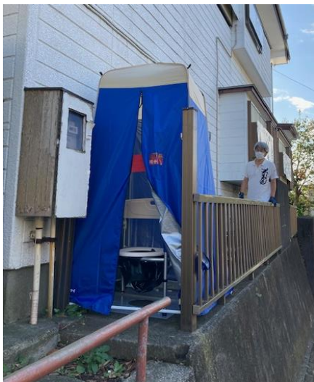
マンホールトイレ

当自治会では災害用のマンホールトイレを備蓄しています。そのマンホールトイレ用の水として、雨水タンクを設置しました。浄水器を使用すれば飲料水として利用できます。